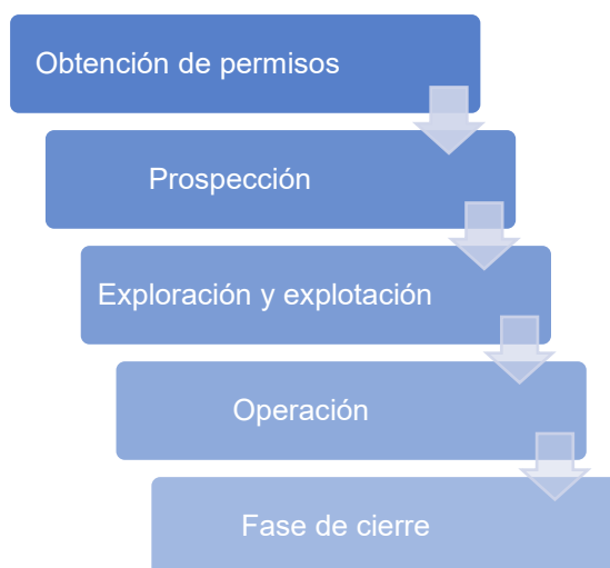
Gráfico N° 4.1 Ciclo de vida

Elaborado por: Malacatus Consulting & Training Cía. Ltda.